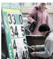
Tableau des cours croisés

EUR/USD 1.2888 -0.07% USD/JPY 79.9630 -0.08% GBP/USD 1.6066 -0.04%